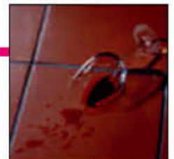
Nr./No. 1 19 14 1000 ml Nr./No. 1 19 15 5000 ml

Dosering: ca. 5-15 m 2 /liter, afhankelijk van het absorptievermogen